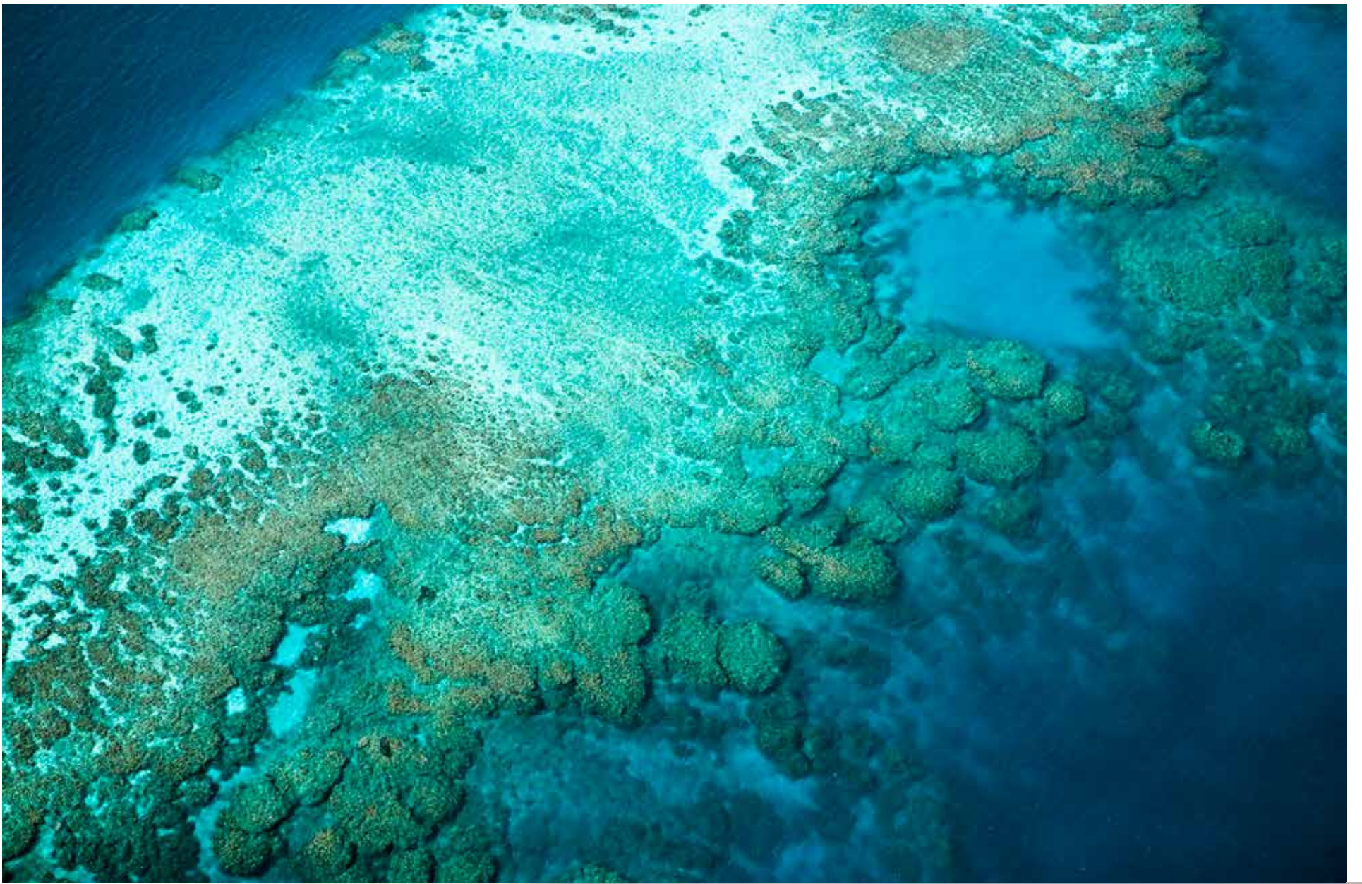
COMO HOTELS AND RESORTS, DE WAAL, RAUTENBACH, COURTESY ANDBEYOND.COM, COURTESY OF ROSSINAVI AND ZAHA HADID ARCHITECTS